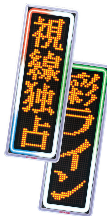
↑これは4文字×1段の縦